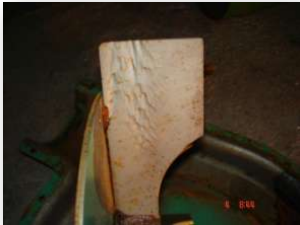
➤ Pá do Rotor