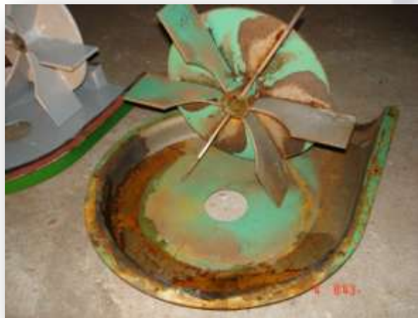
➤ Rotor de passagem de grão;