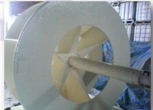
➤ Rotor - Fertilizante