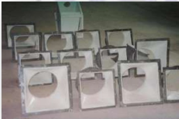
➤ Transição Agrícola