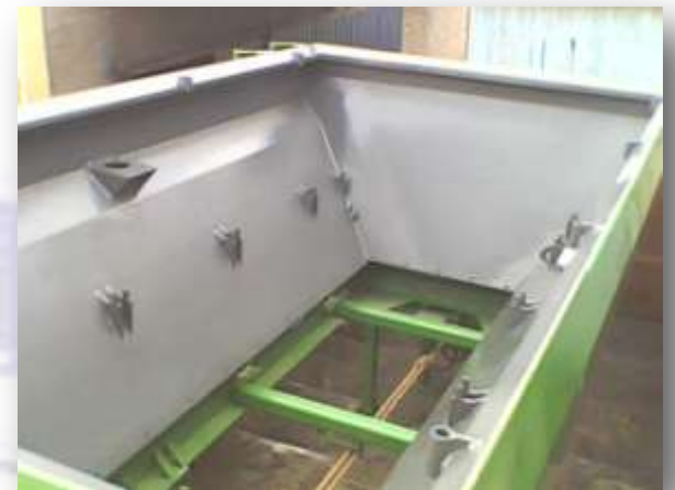
➤ Espalhador de Adubo