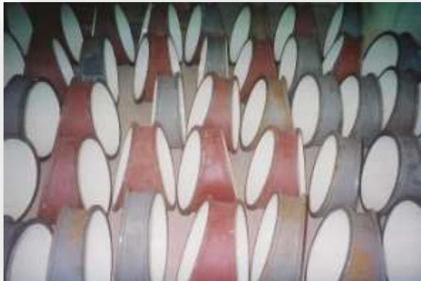
➤ Canalização Agrícola